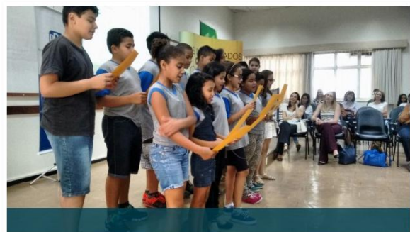
Encerrado Projeto da Fundação Educar D'Paschoal e PPG