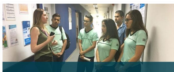
PPG realiza ação de Empresário Sobra Por Um Dia