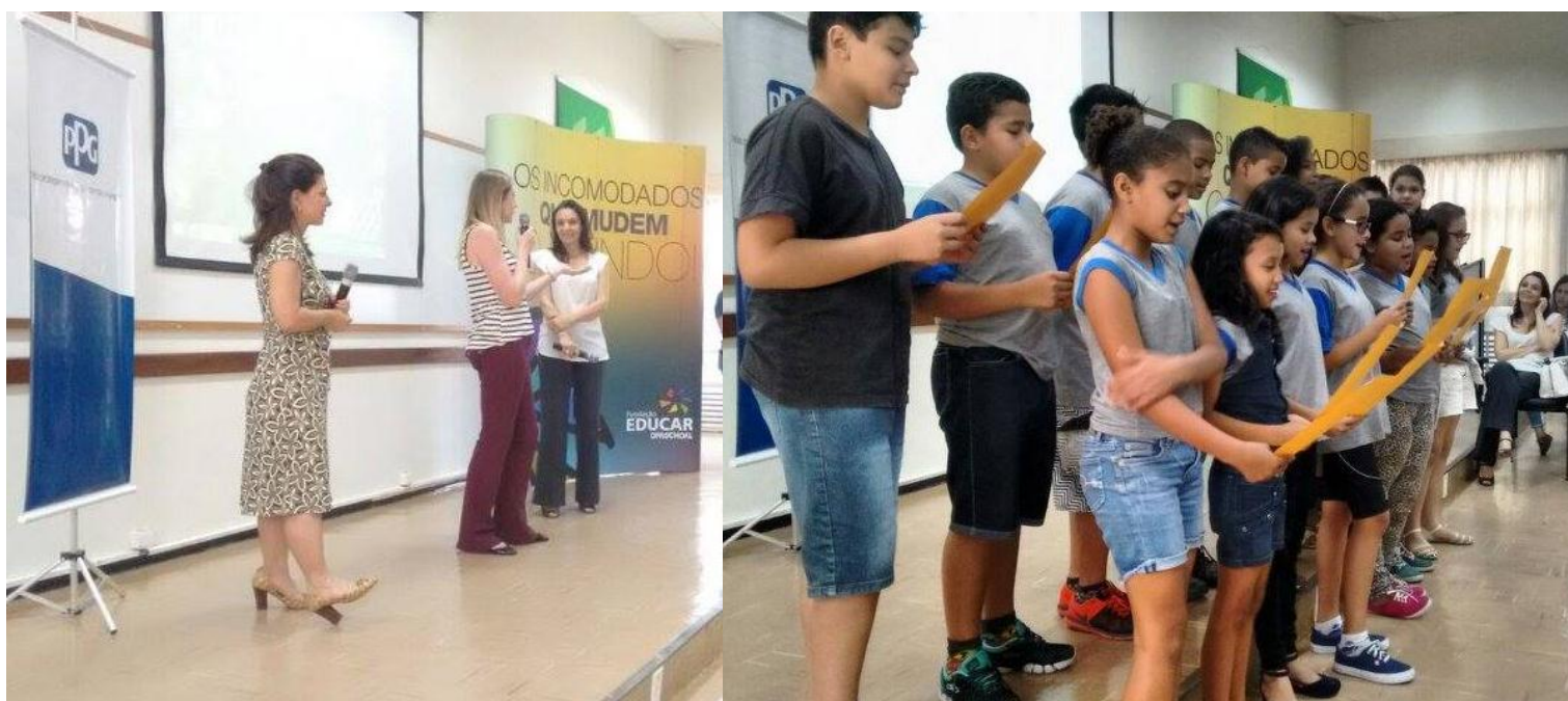
Foto: Encerramento do Programa Nosso Planeta, Nossa Casa

O programa Nosso Planeta, Nossa Casa busca formar verdadeiros multiplicadores da cultura sustentável, sugerindo mudanças de hábitos que minimizam o impacto de nossas ações sobre o meio ambiente.