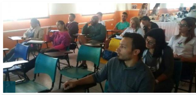
Treinamento de professores pela PPG